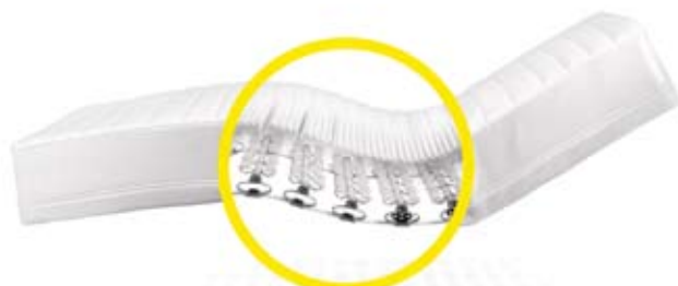
お使いのベッドフレームにそのまま使用できる マットレス・スプリング一体型 Lattoflex800 も発売予定。