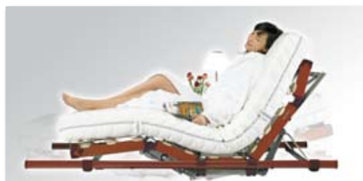
極上のリラクゼーション 電動リクライニングモデル。